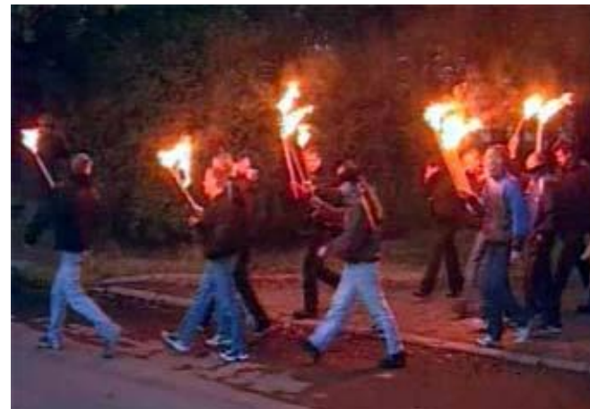
Скинхеды. Факельное шествие в Петербурге.