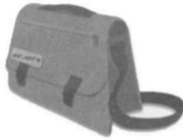
4 s _ _ _ _ l b _ _