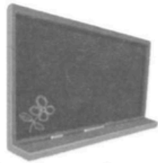
1 _ _ a c k _ o a r _