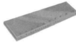
5 _ u _ e _