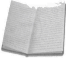
e.g. n o t e b o o k